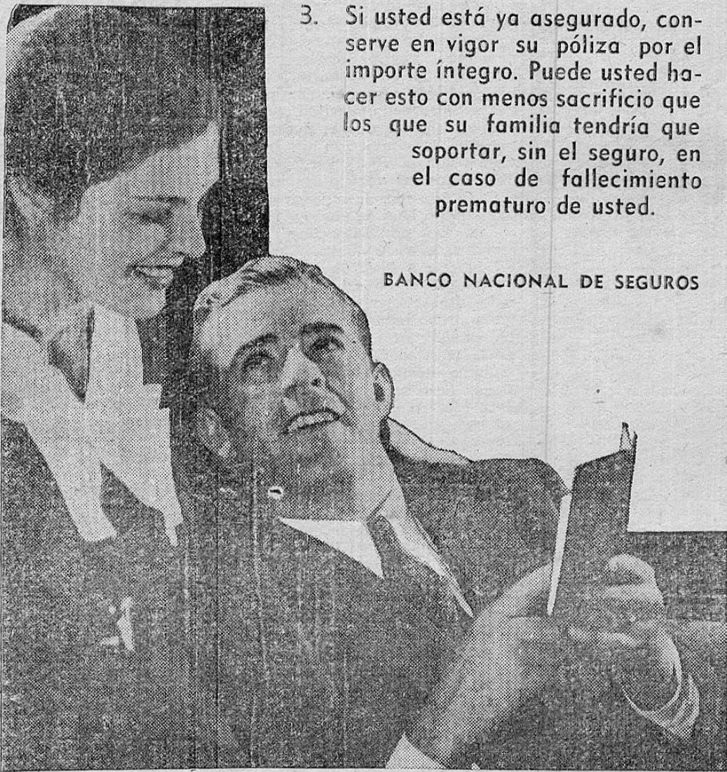
BANCO NACIONAL DE SEGUROS